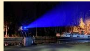
Le faisceau de Cinéco