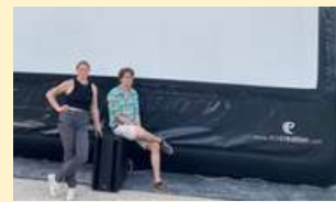
L'équipe de Monde & Multitudes