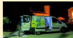
Le camion de la FDFR 46