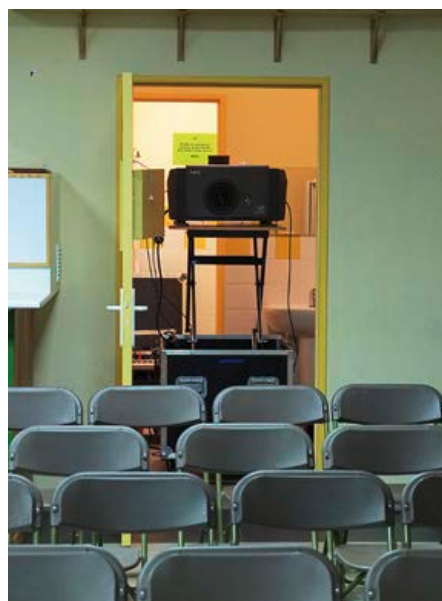
Club-house de Vergt avant l'Atrium

Ciné Passion en Périgord reprend aujourd'hui son rôle d'accompagnement pour la création d'un nouveau lieu à Excideuil, dans la communauté de communes Isle Loue Auvézère. Actuellement, le circuit itinérant projette dans un château médiéval, magnifique mais plus du tout adapté ; il y fait 12 degrés l'hiver, pas très confortable