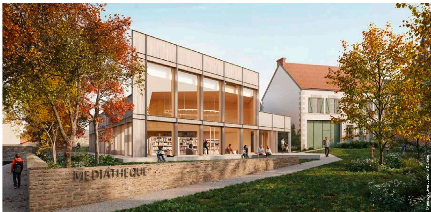
La futur médiathèque de de Sceni qua non à Saint-Pierre-le-Moûtier (58)

[LFI] Il est prévu d'ouvrir fin 2025, mais les travaux n'ont pas encore démarré. Nous avons encore quelques réunions avec l'architecte, afin de finaliser le projet, notamment pour la cabine de projection. Nous espérons pouvoir renforcer nos propositions de cinéma, notamment en y accueillant les projections des dispositifs "École et cinéma" et "Collège au cinéma", dispositifs que nous coordonnons pour la Nièvre. |||