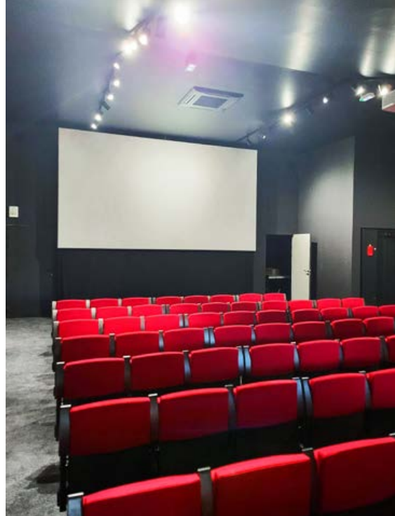
Salle de Villeneuve-Minervois (11)

Contact : Fabrice Caparros, ✉ cinemaude@free.fr 🌐 www.cinemaude.org