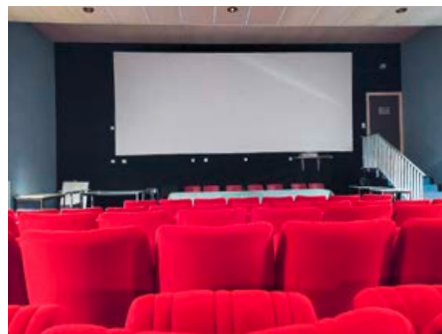
Cinéma municipal d'Axat (11)