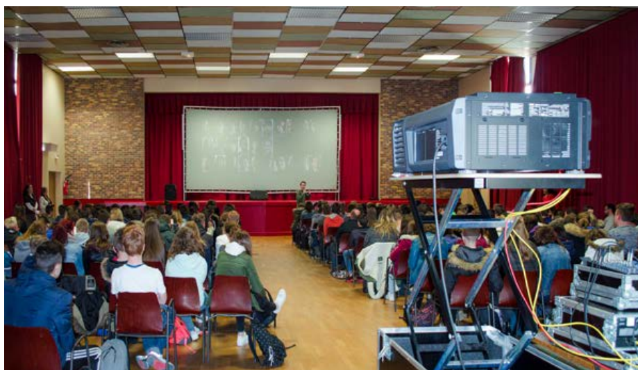
Une séance de cinéma pour le jeune public avec CinéLigue HDF