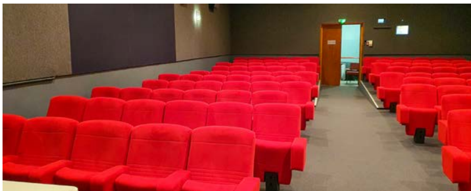
Cinéma municipal de Ferrals-les-Corbières (11)

de salle, en partant de l'expérience que nous avons vécue dans la commune de Gruissan, en 2014. Le maire de la commune était très investi et nous a sollicités pour l'accompagner dans son projet. 140 000 € de subvention régionale ont été obtenus et aujourd'hui, la commune assure 250 séances par an ! Nous sommes pratiquement dans un mode de gestion de salle fixe.